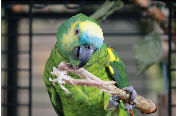
Un loriquet et un amazone à front jaune.

3) Entretenir des oiseaux d'ornement ne coûte pas très cher, l'investissement principal concerne la cage ou la volière et leurs accessoires. Il en va de même pour les psittacidés, mais le budget annuel est plus élevé, tant au niveau nourriture (alimentation fraîche et variée avec beaucoup de gâchis) que renouvellement des accessoires. Pour les oiseaux, une visite chez le vétérinaire en cas de maladie peut être coûteuse car il est rarement possible d'établir un diagnostic sans réaliser certains examens (analyses de sang ou de selles, radiographie, etc).